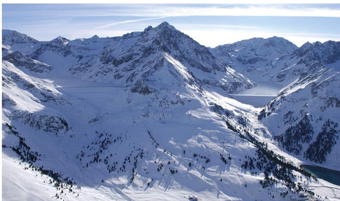
Geplanter Speichersee Kühtai